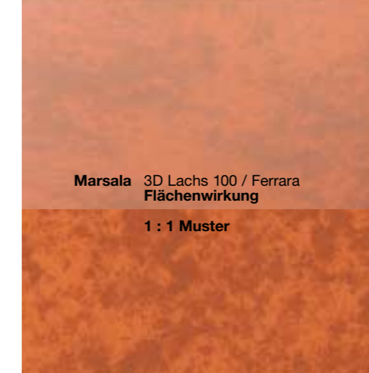
Marsala 3D Lachs 100 / Ferrara Flächenwirkung 1 : 1 Muster