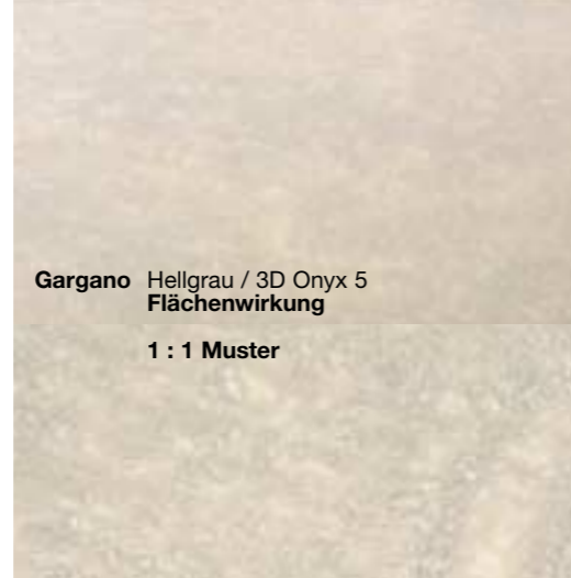
Gargano Hellgrau / 3D Onyx 5 Flächenwirkung 1 : 1 Muster