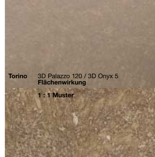
Torino 3D Palazzo 120 / 3D Onyx 5 Flächenwirkung 1 : 1 Muster