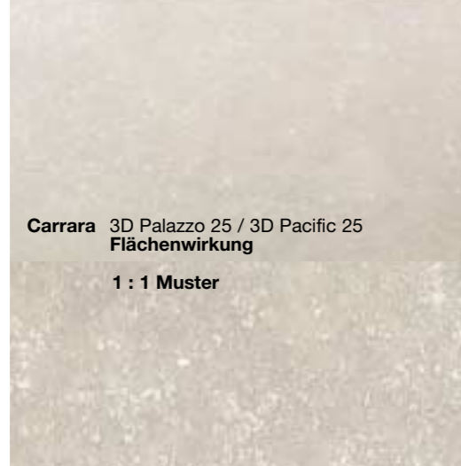
Carrara 3D Palazzo 25 / 3D Pacific 25 Flächenwirkung 1 : 1 Muster