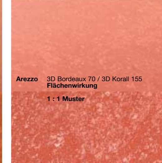
Arezzo 3D Bordeaux 70 / 3D Korall 155 Flächenwirkung 1 : 1 Muster