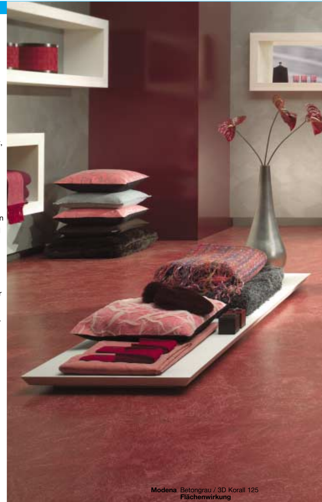
Modena Betongrau / 3D Korall 125 Flächenwirkung

Kleinformatige Farbmuster können natürlich nur bedingt einen Aufschluß über die tatsächliche Flächenwirkung der gewählten Farbzusammenstellung geben, darum empfiehlt sich die Beratung durch entsprechend geschulte Fachleute.